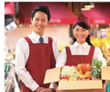
▲物価・燃料高騰支援に全力投球

この度、物価高騰に対する消費喚起策として、都内店舗でのQRコード決済ポイント最大10%還元(上限3千円、R6.3~)に100億円、学校給食の負担軽減に7千万円、保育所や特養老人ホーム等の福祉関連施設への緊急支援に24億5千万円、運輸事業者向け燃料費対策に15億円など、都民生活支援・中小企業を守る取り組み拡充への経費803億円を緊急補正予算として計上しました。